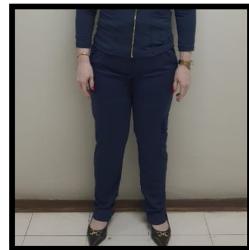
Figura 1 – Blusa Scrub Nutricionista Azul Marinho