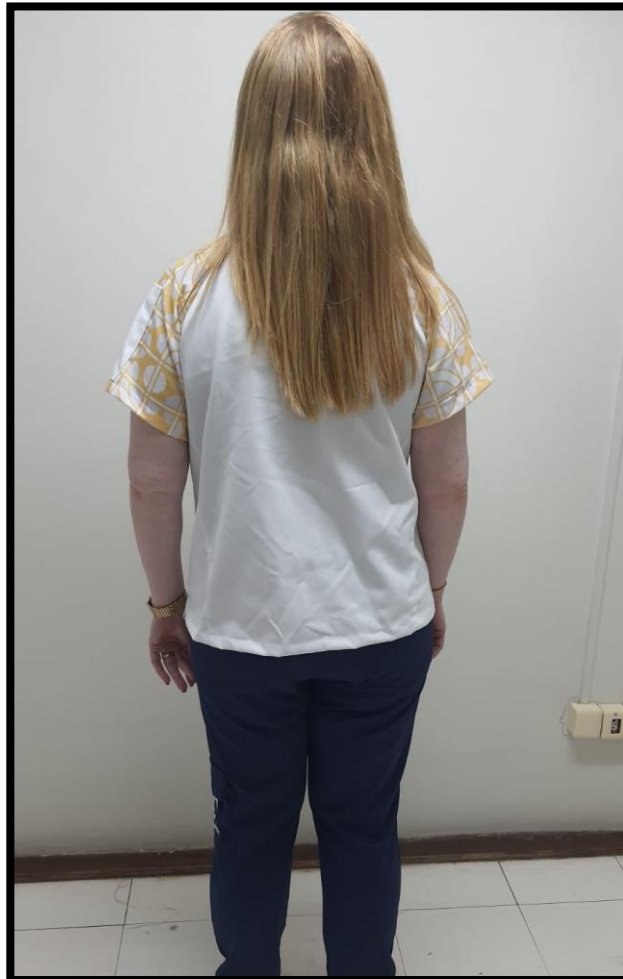
Figuras 1 e 2 – Dolma Edição Especial - Itamaraty