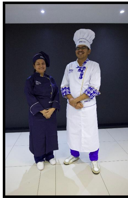
Figura 1 – Dolmã Evento ajudante de cozinha