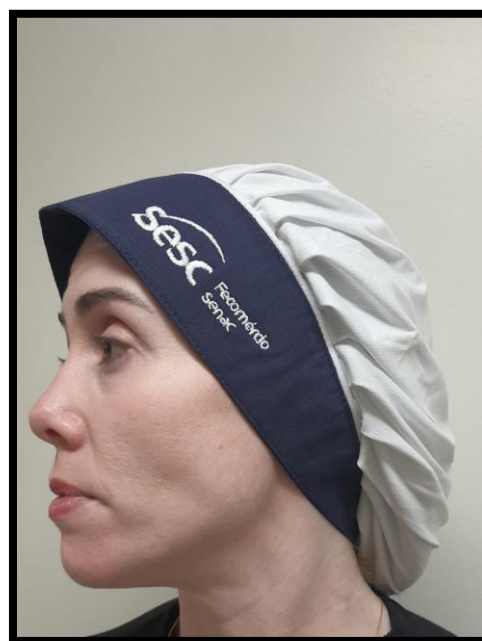
Figura 1 – Calça de serviço cozinheiro e touca chef cozinheiro