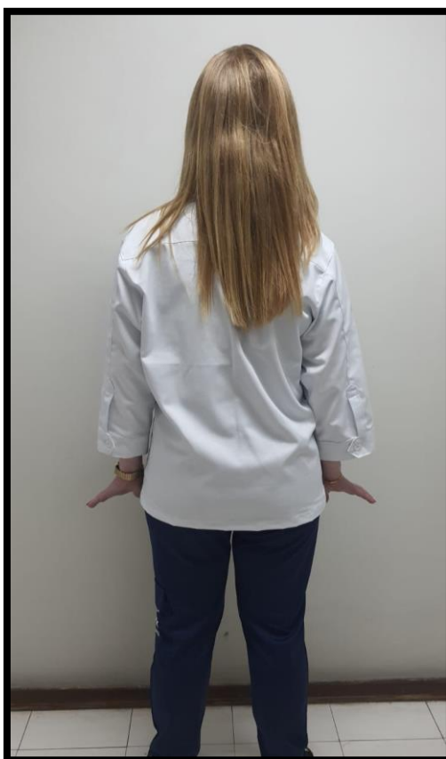
Figuras 1 e 2 – Dolma Edição Especial - Palace