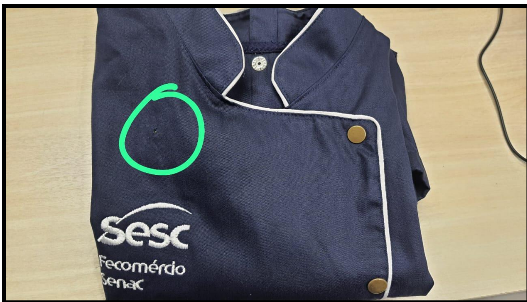
Figura 1 – Dolmã evento Feminina