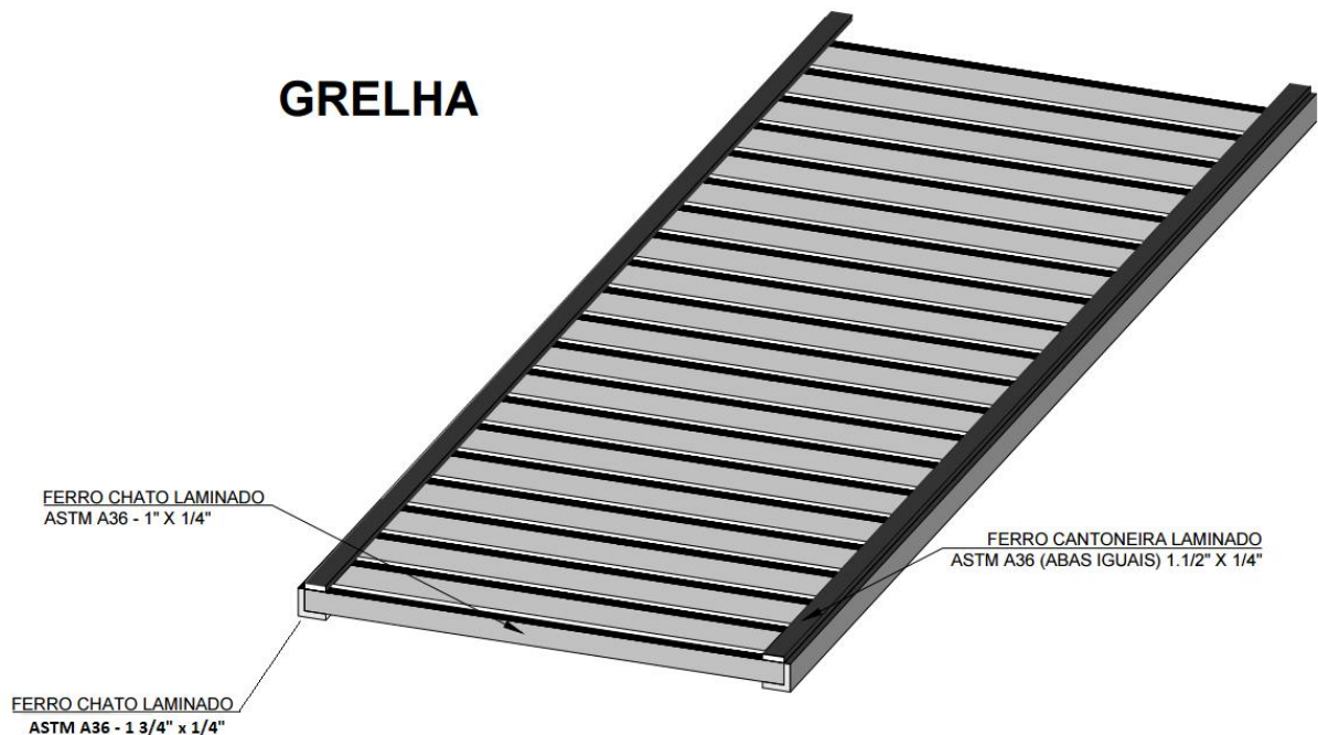
Figura 1 - Detalhe da grelha