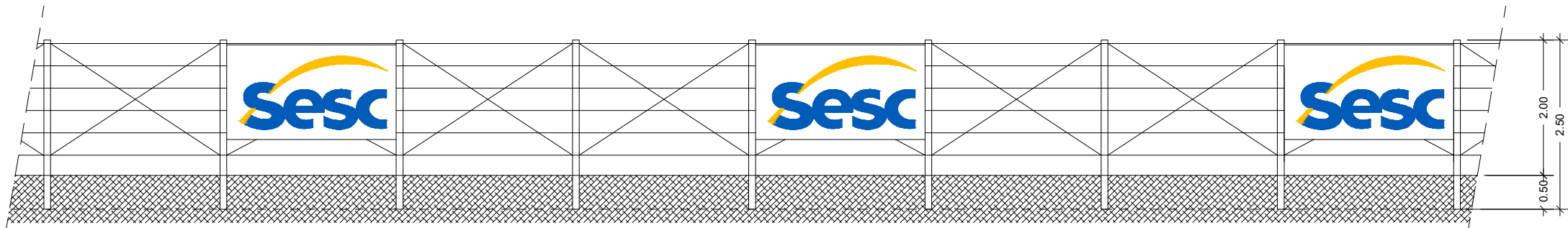
VISTA FRONTAL DO CERCAMENTO